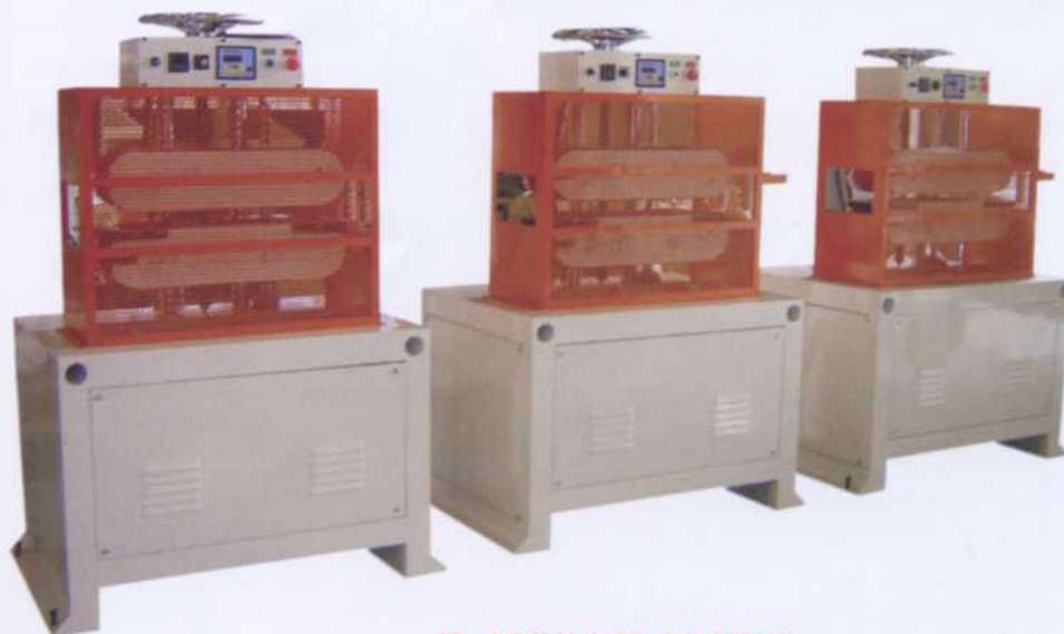
Haul Off Unit Model: 50TOB

หมายเหตุ : คุณลักษณะของข้อมูลเครื่องจักรที่แจ้งนี้อาจมีการเปลี่ยนแปลงโดยที่ทางบริษัทไม่ต้องแจ้งให้ทราบล่วงหน้า