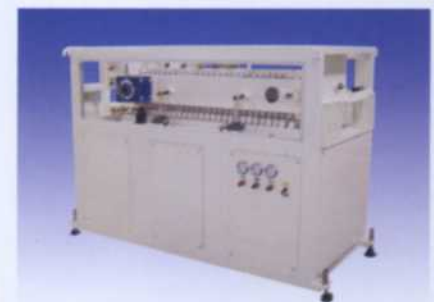
Take Off Unit Model: 120 TOC