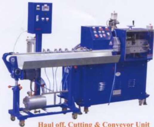
Haul off, Cutting & Conveyor Unit

หมายเหตุ : คุณลักษณะของข้อมูลเครื่องจักรที่แจ้งนี้อาจมีการเปลี่ยนแปลงโดยที่ทางบริษัทมีต้องแจ้งให้ทราบล่วงหน้า