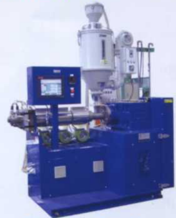
Single Screw Extruder