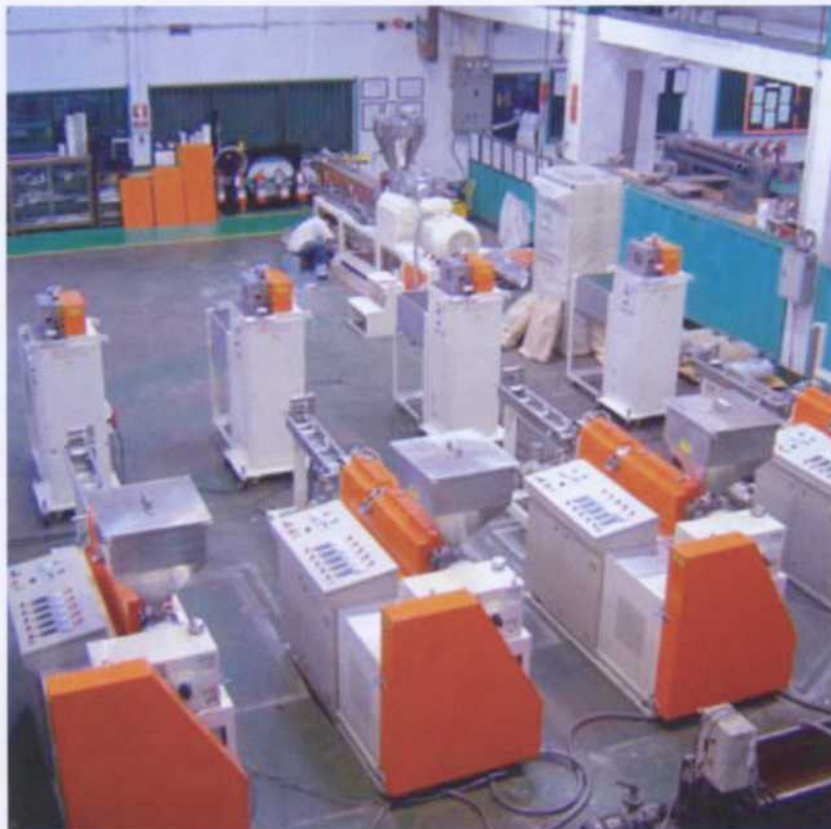
Machine in assembly line

หมายเหตุ : คุณลักษณะของข้อมูลเครื่องจักรที่แจ้งนี้อาจมีการเปลี่ยนแปลงโดยที่ทางบริษัทไม่ต้องแจ้งให้ทราบล่วงหน้า