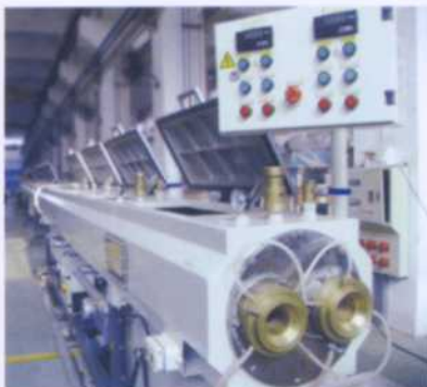
Die for Double Strand