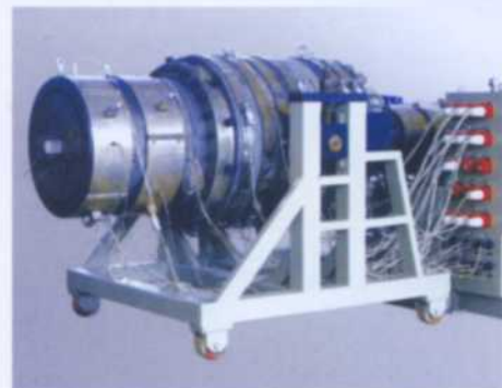
Mold for PVC